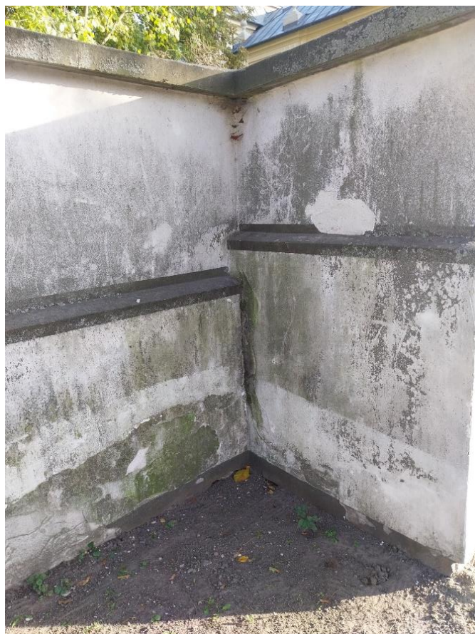
fot. 21 Radzyń Podlaski, mur zachodni, widok ścian narożnych przy bramie nr I widoczna zniszczona powierzchnia tynku pokryta nawarstwieniami i zielenicami z pierwszą fazą złuszczenia warstw tynków w przyziemiu, stan obiektu 2024 r.