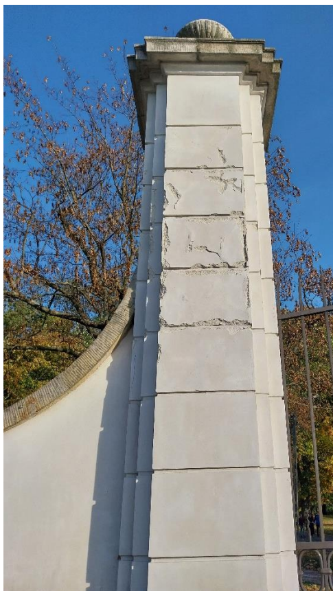
fot. 13 Radzyń Podlaski, Brama zachodnia oś Wschód Zachód, widok od ulicy Jana Pawła II, widoczne zniszczenie tynków na krawędziach boniowania, stan obiektu 2024