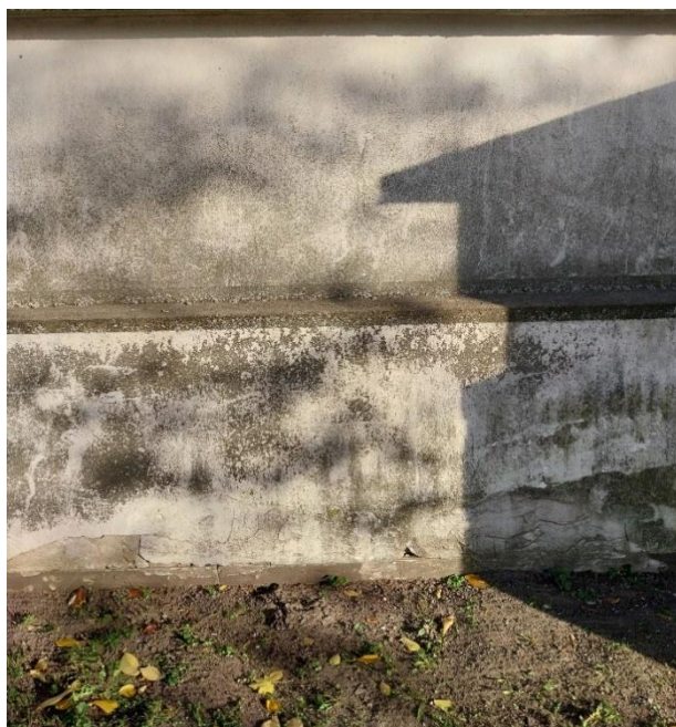
fot. 22 Radzyń Podlaski, mur zachodni, widok muru przy bramie nr I, widoczna zniszczona powierzchnia tynku pokryta nawarstwieniami i zielenicami z pierwszą fazą złuszczenia warstw tynków w przyziemiu, stan obiektu 2024 r.