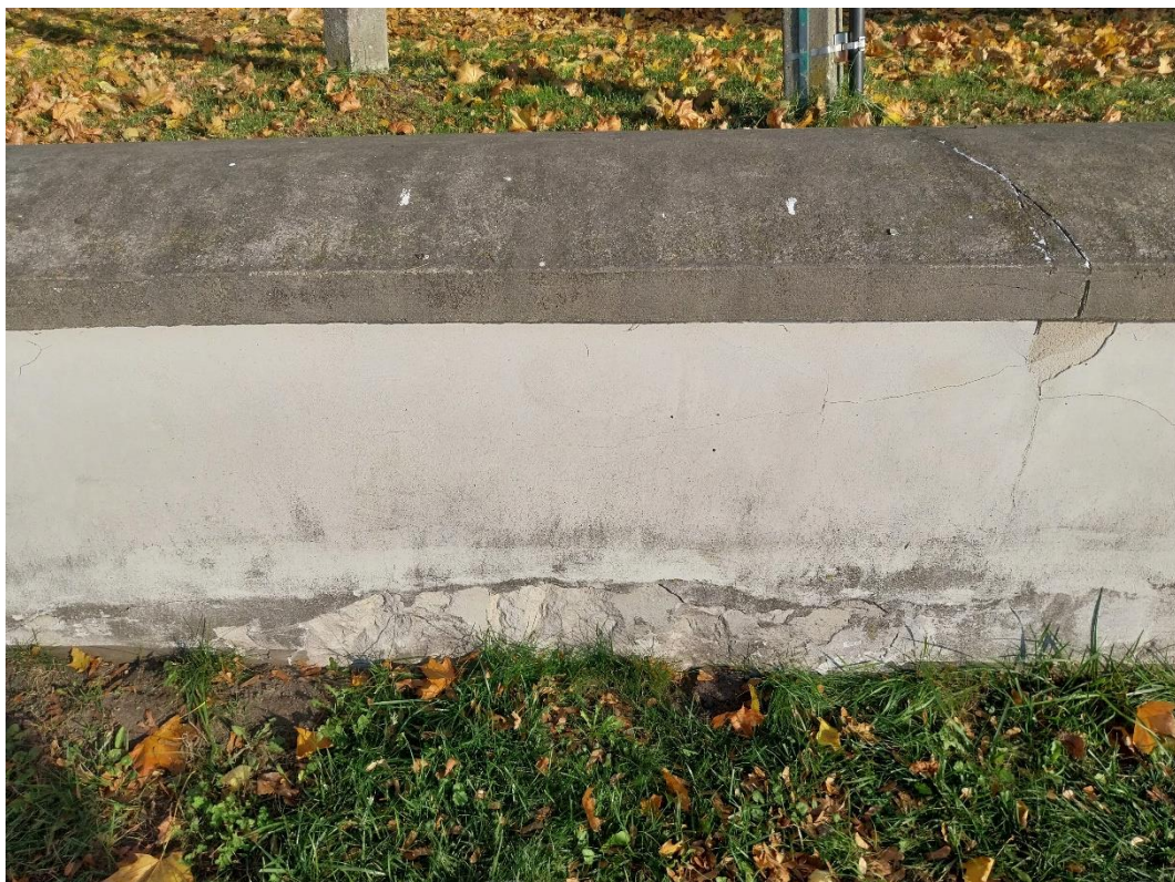
fot. 18 Radzyń Podlaski, mur zachodni, widok od strony ulicy Jana Pawła II, widoczne zniszczenia betonowej nakrywy,. Pęknięcia przenoszone na strukturę muru, stan obiektu 2024 r.