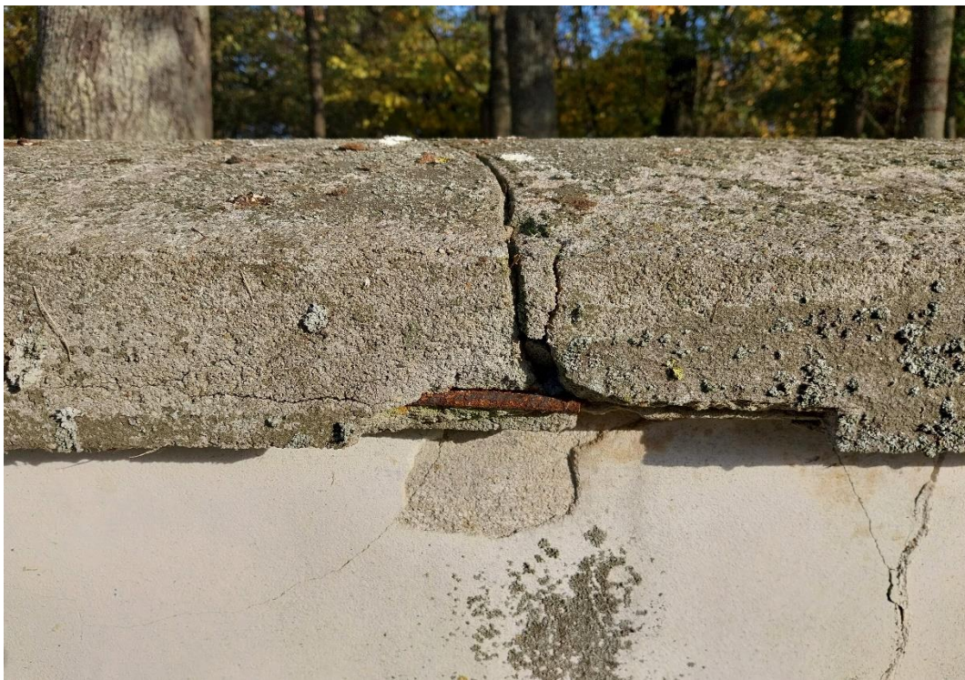
fot. 17 Radzyń Podlaski, mur zachodni, widok od strony ulicy Jana Pawła II, widoczne zniszczenia betonowej nakrywy, stan obiektu 2024 r.