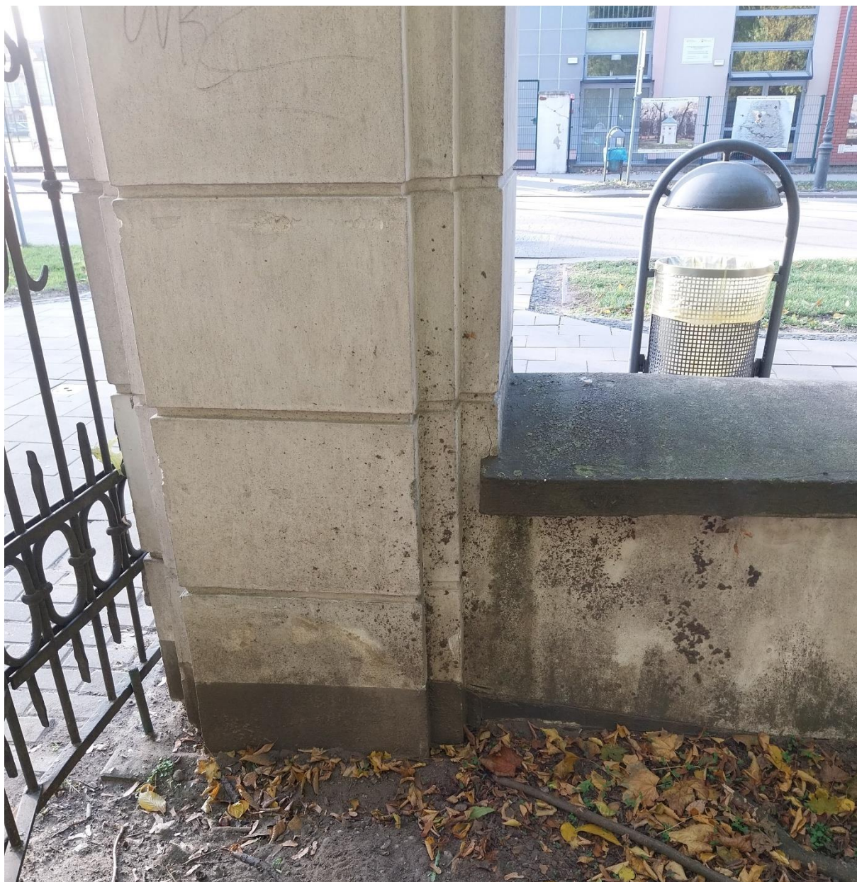
fot. 12 Radzyń Podlaski, Brama zachodnia oś Wschód Zachód, widok od strony parku, stan obiektu 2024 r.