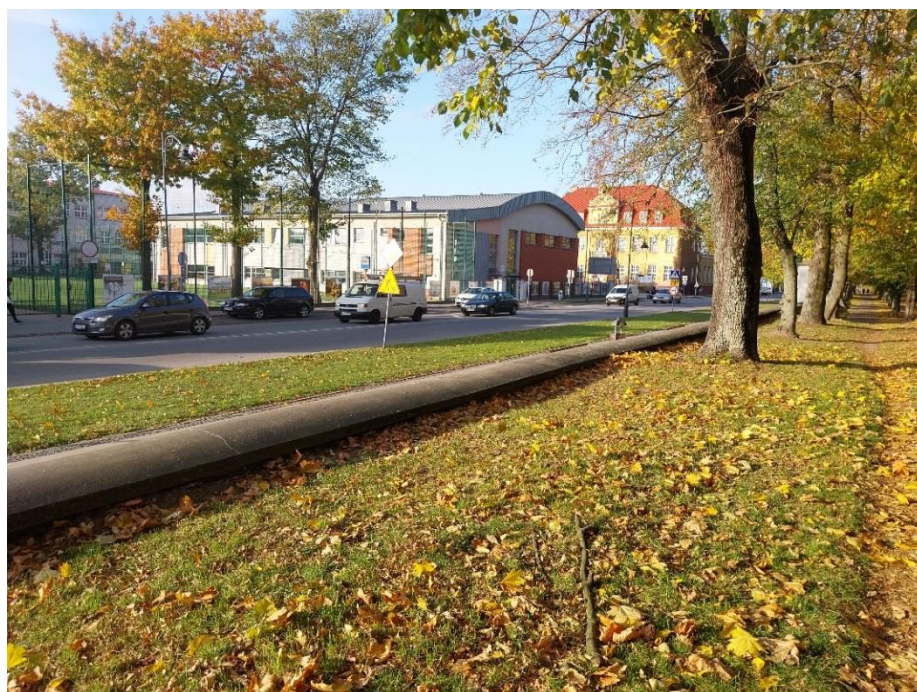
Fot. 7 Radzyń Podlaski, mur zachodni od strony parku widoczny podwyższony poziom gruntu, stan obiektu 2024 r.

Problem migracji wód w głąb muru w sposób oczywisty uwidacznia się od strony parku, gdzie nadmiar ziemi przykrywa ścianę muru niekiedy do wysokości nakrywy. Migrujące wody miejsce swojego odparowywania odnajdują w masie tynków od strony ulicy. Tam poziom gruntu jest nieco powyżej fundamentu muru. W oczywisty sposób procesy zniszczeń zachodzą intensywniej w miejscu odparowywania wody . Procesy niszczące powtarzające się w cyklach pogodowych w szybkim czasie niszczą tynki zewnętrzne na powierzchni muru od strony ulicy.