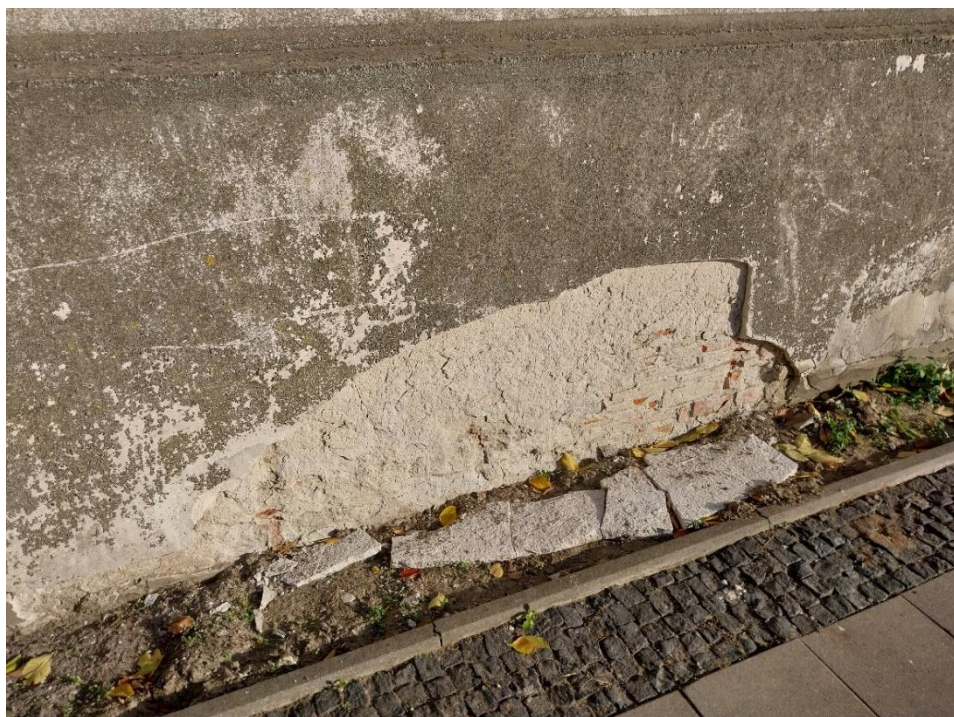
fot. 25 Radzyń Podlaski, mur zachodni, widoczne zniszczona powierzchni tynków z pierwszą i drugą fazą złuszczenia warstw tynków przyziemiu, stan obiektu 2024 r.