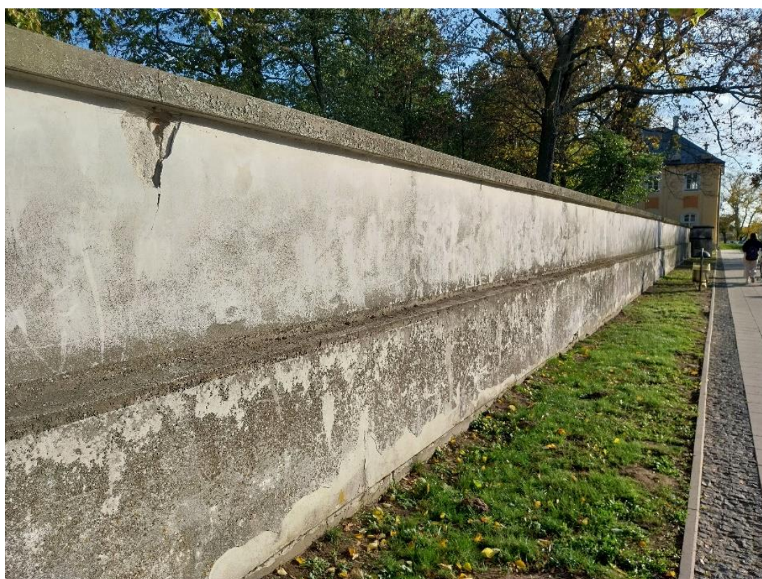
Fot. 6 Radzyń Podlaski, mur zachodni od str. Ul. Jana Pawła II, (dawny KoziRynek), stan obiektu 2024 r.

Brakuje dodatkowych informacji o kształcie muru wzdłuż zachodniego boku ogrodu. Od stropy południowej zachował się w oryginalnej formie mur i według opisów i stanu obecnego nie był on zbyt wysoki i być może takiej wysokości był mur od strony zachodniej.