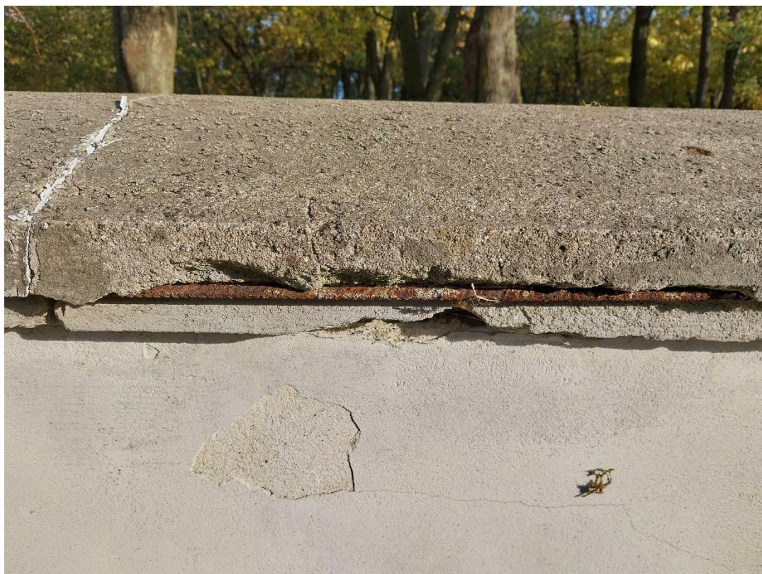
fot. 16 Radzyń Podlaski, mur zachodni, widok od strony ulicy Jana Pawła II, widoczne zniszczenia betonowej nakrywy, stan obiektu 2024 r.