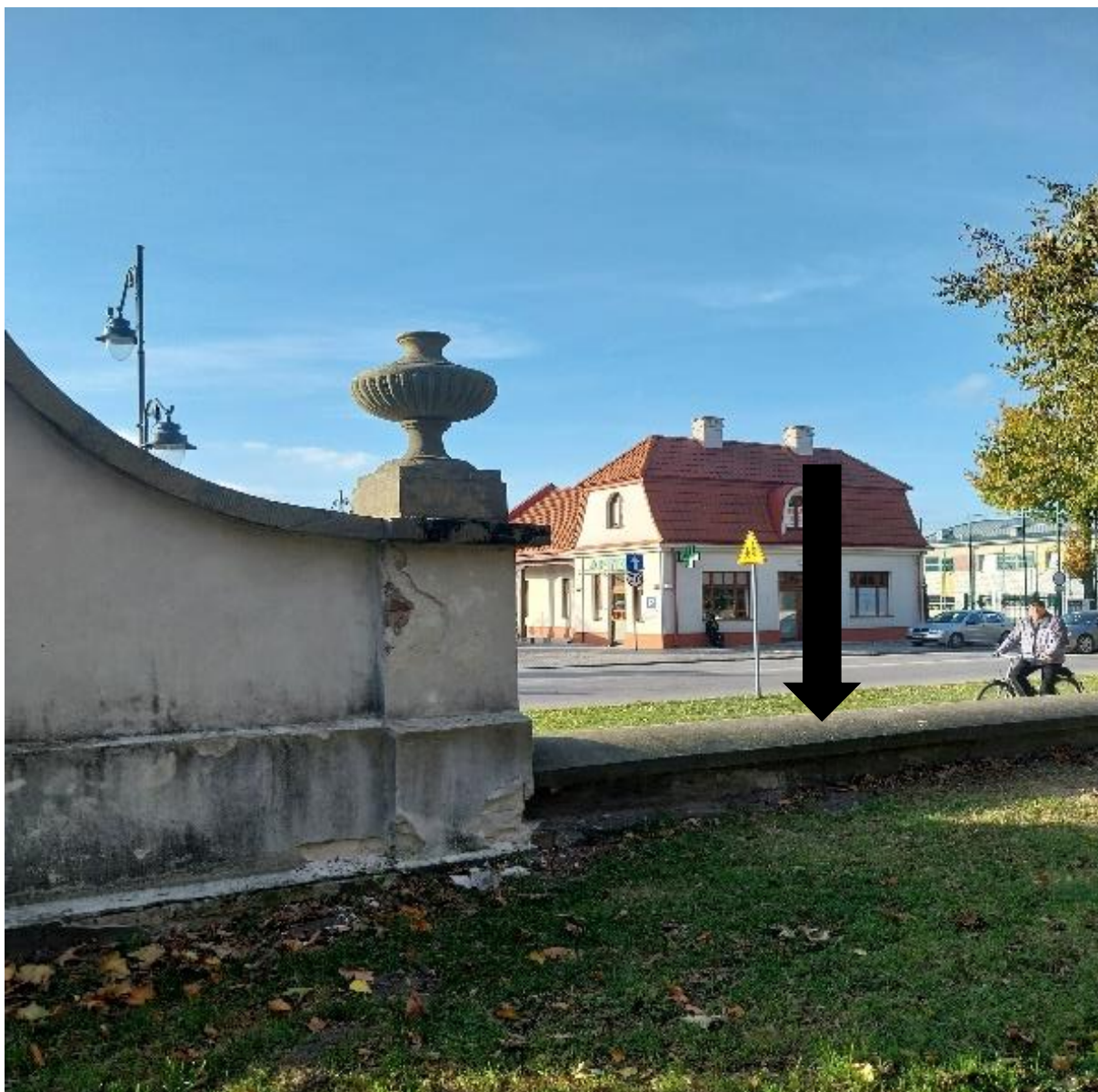
Fot. 2 Radzyń Podlaski, Brama oś Zachód- Wschód , stan obiektu 2024 r. Widoczna wysokość muru od bramy zachodniej i wzdłuż parku.