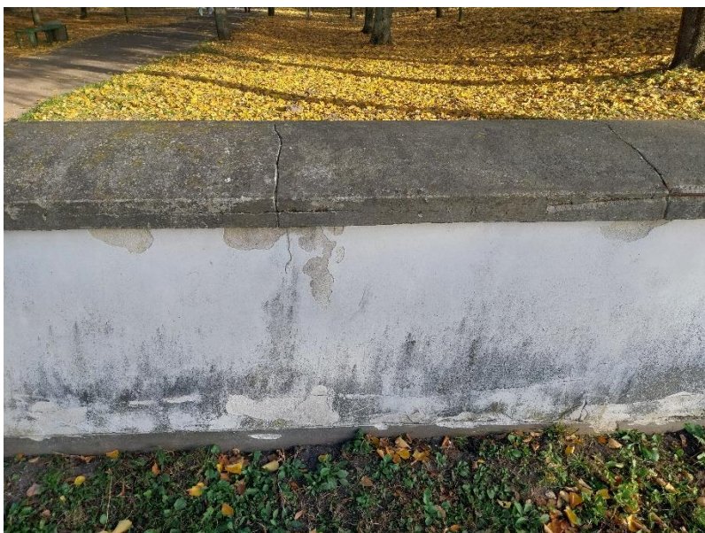
fot. 15 Radzyń Podlaski, mur zachodni, widok od strony ulicy Jana Pawła II, widoczne poprzeczne pęknięcia betonowej nakrywy, stan obiektu 2024 r.