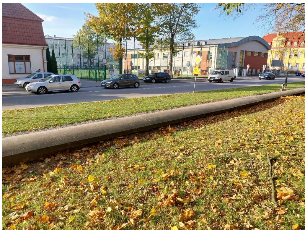
fot. 20 Radzyń Podlaski, mur zachodni, widok od strony parku, widoczne wysoki poziom gruntu pogrążający ścianę muru aż po nakrywę, stan obiektu 2024 r.