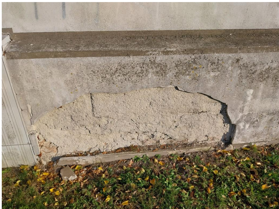
fot. 14 Radzyń Podlaski, mur zachodni, widok od strony ulicy Jana Pawła II, widoczne złuszczenia tynków, stan obiektu 2024 r.