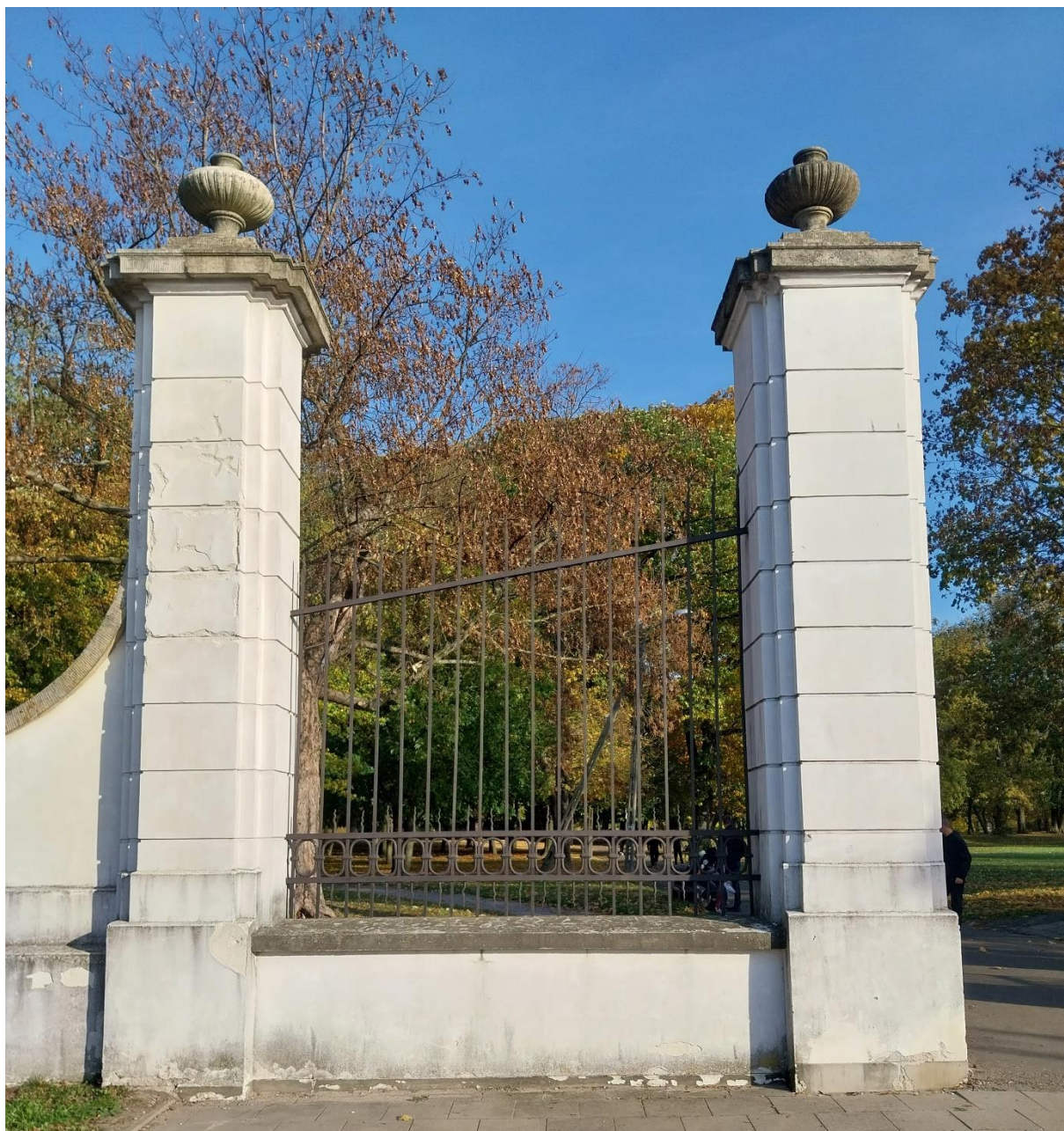
fot. 11 Radzyń Podlaski, Brama zachodnia oś Wschód Zachód, widok od strony ulicy Jana Pawła II, stan obiektu 2024 r.