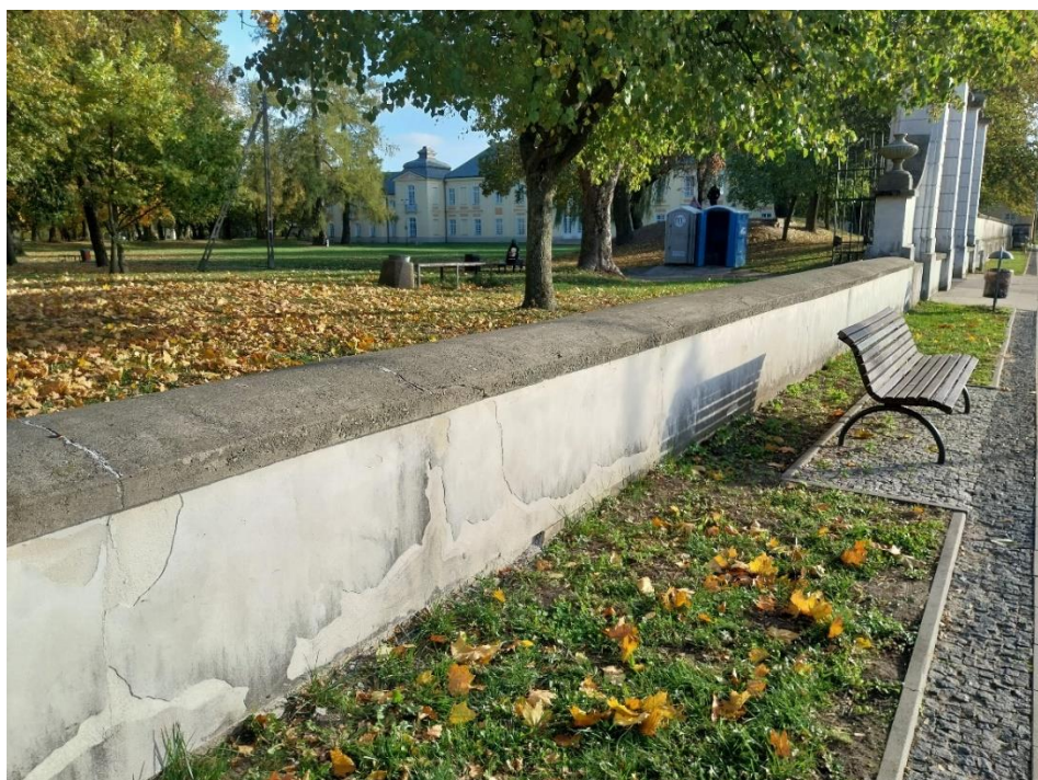
fot. 24 Radzyń Podlaski, mur zachodni, widoczne zniszczona powierzchni tynków z pierwszą fazą złuszczenia warstw tynków przyziemiu, stan obiektu 2024 r.