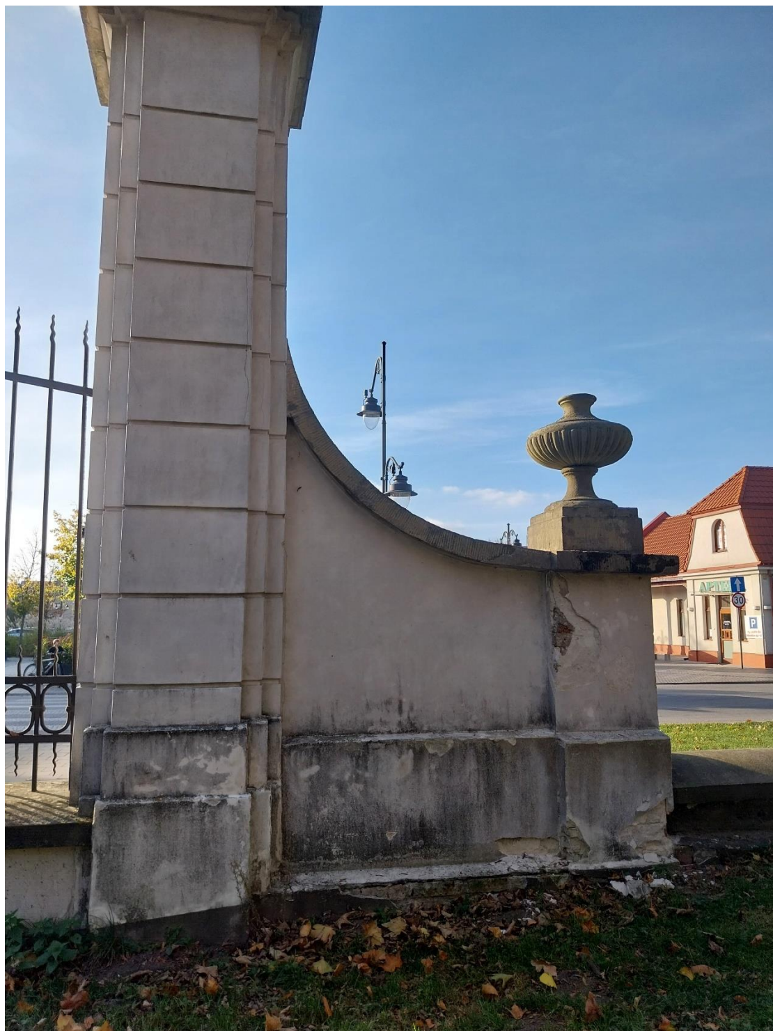
Fot. 10 Radzyń Podlaski, Brama zachodnia oś Wschód Zachód, widok od strony parku, stan obiektu 2024 r.