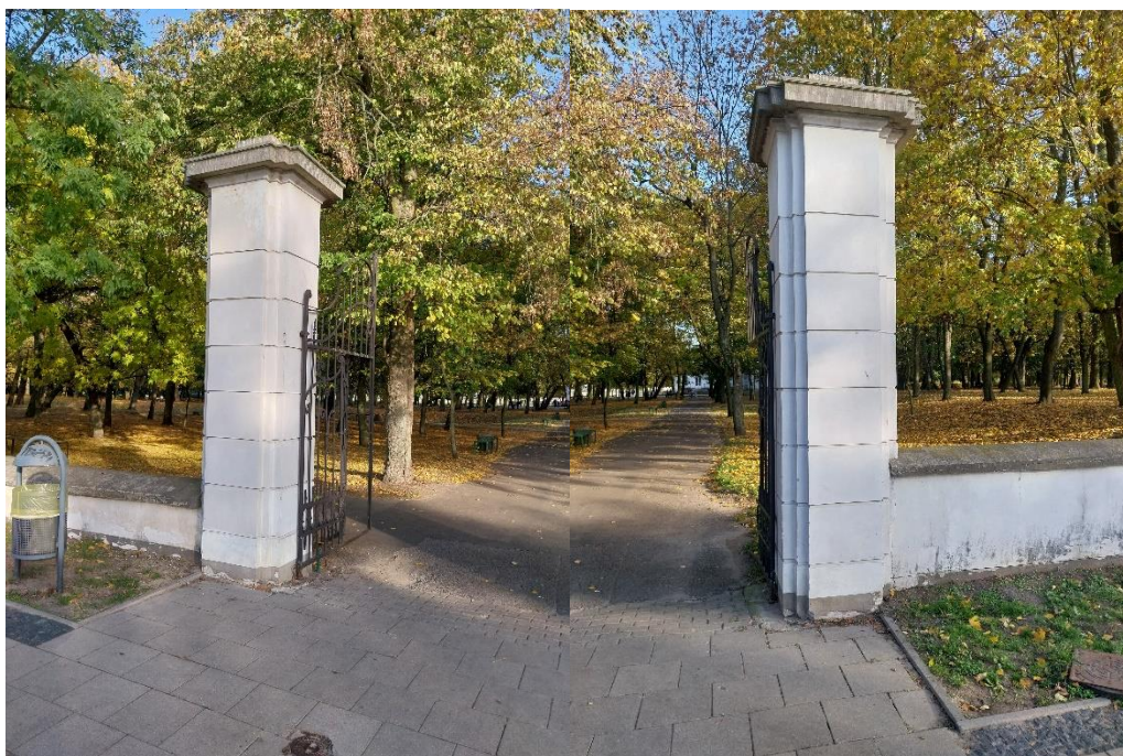
Fot. 4,5 Radzyń Podlaski, Bram mniejsza oś Zachód- oranżeria II , stan obiektu 2024 r.

Brakuje dodatkowych informacji o kształcie muru wzdłuż zachodniego boku ogrodu. Od stropy południowej zachował się w oryginalnej formie mur i według opisów i stanu obecnego nie był on zbyt wysoki i być może takiej wysokości był mur od strony zachodniej.