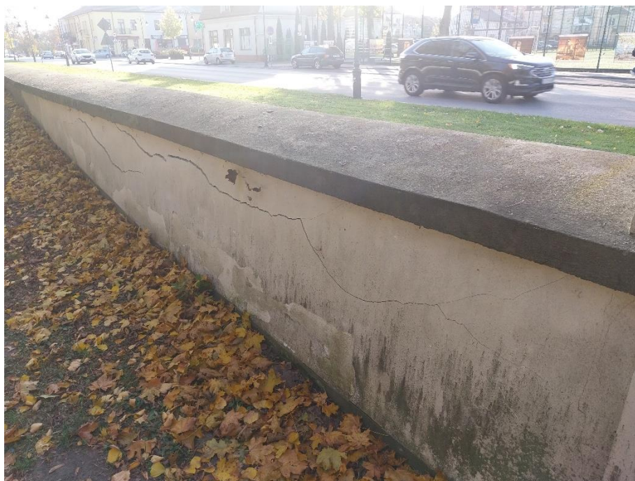
Fot. 6 Radzyń Podlaski, mur zachodni od strony parku, widoczne poziome pęknięcia , stan obiektu 2024 r.

Problem migracji wód w głąb muru w sposób oczywisty uwidacznia się od strony parku, gdzie nadmiar ziemi przykrywa ścianę muru niekiedy do wysokości nakrywy. Migrujące wody miejsce swojego odparowywania odnajdują w masie tynków od strony ulicy. Tam poziom gruntu jest nieco powyżej fundamentu muru. W oczywisty sposób procesy zniszczeń zachodzą intensywniej w miejscu odparowywania wody . Procesy niszczące powtarzające się w cyklach pogodowych w szybkim czasie niszczą tynki zewnętrzne na powierzchni muru od strony ulicy.