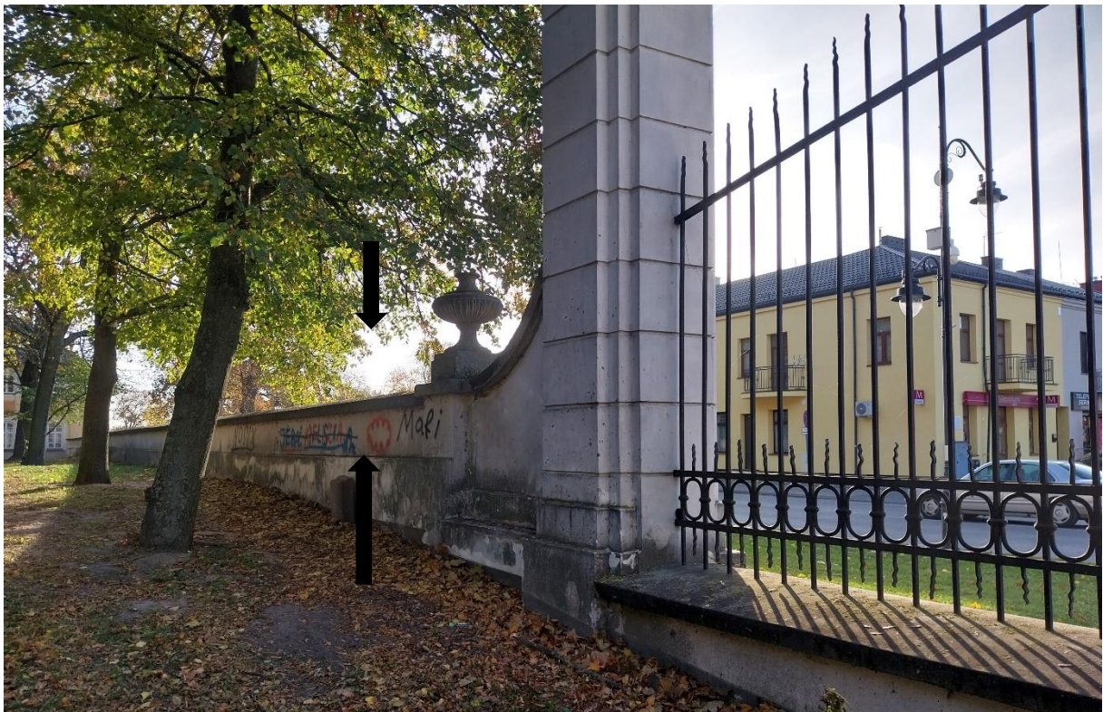
Fot. 1 Radzyń Podlaski, Brama oś Zachód- Wschód, stan obiektu 2024 r.

Spływy wolutowe pierwszej bramy oraz część muru od skrzydła zachodniego do prawej strony pierwszej bramy wyznaczają estetyczną wysokość dawnego ogrodzenia, a zachowany murek, który biegnie od pierwszej bramy dalej wzdłuż parku przypomina w tym kontekście cokół lub dolną jego zachowaną część.