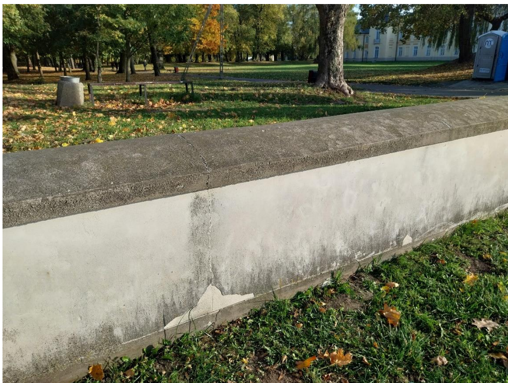
fot. 19 Radzyń Podlaski, mur zachodni, widok od strony ulicy Jana Pawła II, widoczne pionowe pęknięcia muru przeniesione na strukturę nakrywy, , stan obiektu 2024 r.