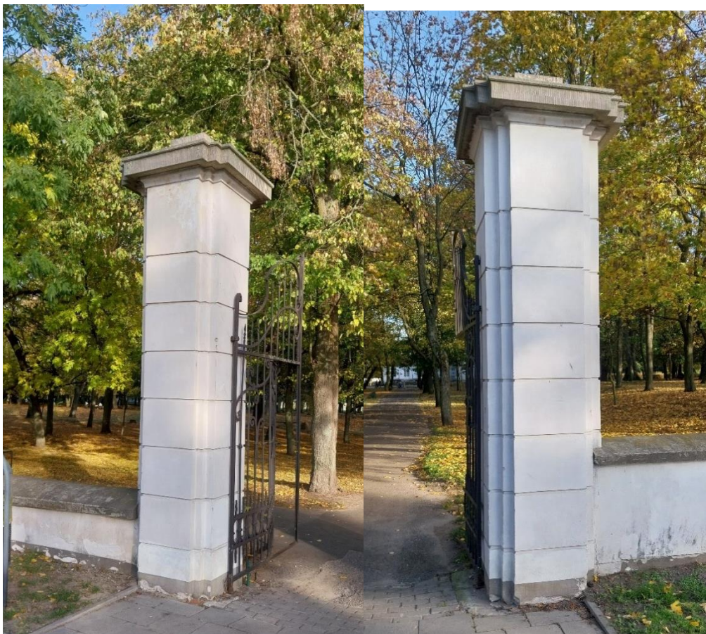
fot. 23 Radzyń Podlaski, brama zachodnia nr I, stan obiektu 2024 r.