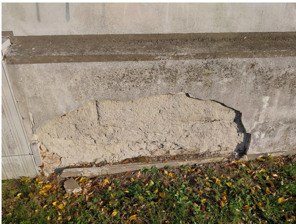
Fot. 8 Radzyń Podlaski, mur zachodni od strony ulicy Jana P.II widoczne głębokie złuszczenia tynków , stan obiektu 2024 r.