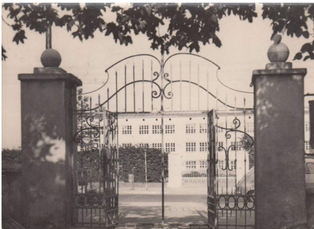
Fot. 1. Brama druga mała. Widoczne proste słupy ze zwieńczeniami. Brama stalowa w formie niezmienionej. Rok 1954, źródło – fotopolska.eu.

Parkan wraz z dwoma bramami wejściowymi zlokalizowany wzdłuż ulicy Jana Pawła II i zlokalizowany jest od strony zachodniej parku. Parkan łączy się z północną częścią ściany pałacu. Od strony pałacu do pierwszej bramy ściana parkanu stanowi mur oporowy nasypu, uformowanego prawdopodobnie wtórnie. Przed bramą I (dużą) nasyp niweluje się do poziomu alejek. Pierwsza brama rozbudowana ze zdwojonymi słupami zwieńczonymi gazonami, ujęta spływami i mniejszymi słupkami, również zwieńczonymi gazonami. Przed pierwszą bramą parkanu w ścianie muru oporowego zlokalizowano wtórnie skrzynkę elektryczną. Kolejna część muru jest najprawdopodobniej pozostałością po pierwotnym, wyższym ogrodzeniu pałacu. Brama II (mała) w formie dwóch prostych słupów z boniowaniami – odtworzona do pierwotnej postaci. Dalej niski murek cokołowy.